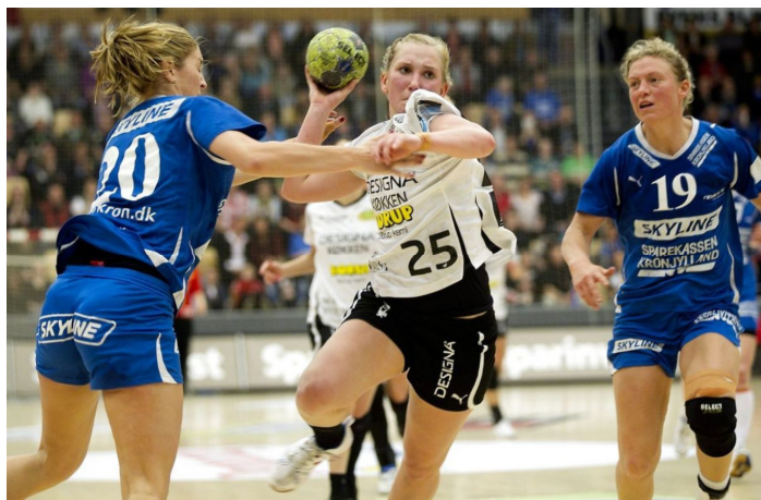
Figur 1: Håndboldbanen